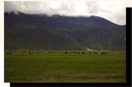
◎ 风吹草低见牛羊 ——朱平摄于云南香格里拉

看了上期几位员工的摄影作品，不知大家有何感想？是否跃跃欲试？那就把你的得意之作发给我们吧。