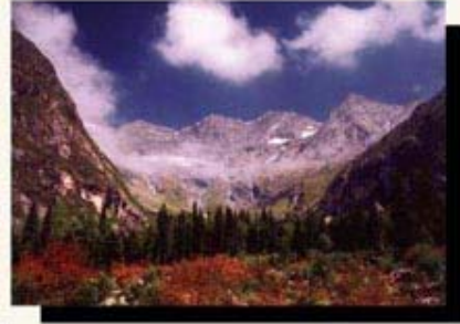
◎ 仙境 ——唐思伟摄于四川省日隆镇四姑娘山双桥沟