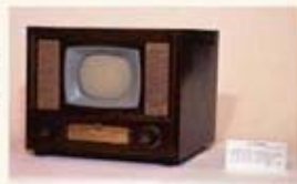
1948年的东芝黑白电视机

1995年，东芝签署了关于在大连建立彩电生产基地的意向书，得到国家计划委员会的批准后，于1996年9月举行了大连东芝电视有限公司的成立仪式。