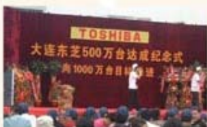
销售累计500万台达成庆典