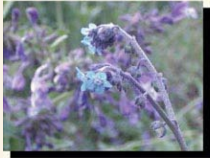
◎ 空谷幽兰 ——慕子摄于云南碧塔海山顶