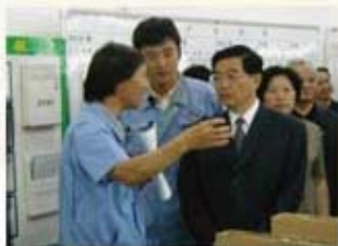
胡博涛主席于2002年6月视察DLTV

歌舞及小品、服装表演等色彩纷呈的节目和演出，展示了东芝员工的奕奕风采，展示了员工们因为非典而压抑许久的激情及对公司的自豪感，同时，也显示了东芝日趋发展的蓬勃生机。