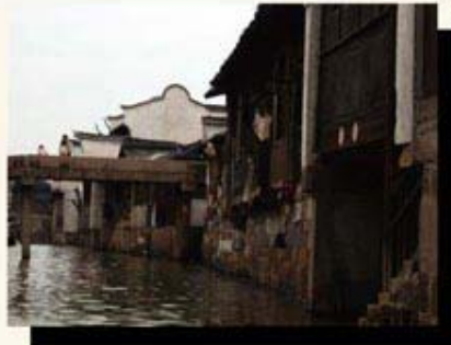
◎ 小桥·流水·人家 ——沈燕摄于浙江乌镇